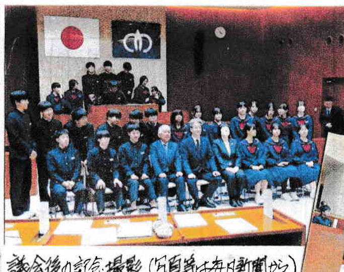
議会後の訪談撮影

11月20日、「穴水町中学生議会」が開か れました。地震後の復興まちづくり、15 の3年生がいくつかの提言をしました。 答弁には、町長以外は通常の議会で 答弁の機会がない 課長補佐級の方 に任せました。 中学生の提言が所 政に生かされるか...。 穴水町で見た本を!!